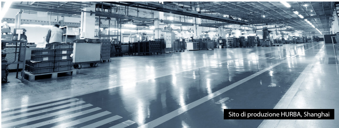
Sito di produzione HURBA, Shanghai